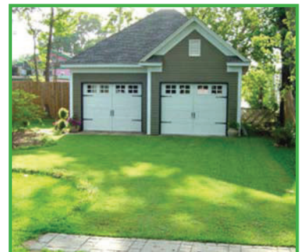
Entrada vehicular de césped

Existen requisitos de mantenimiento para pavimentos o adoquines permeables también. Consulte las pautas de gestión de aguas pluviales del pavimento permeable para obtener más información.