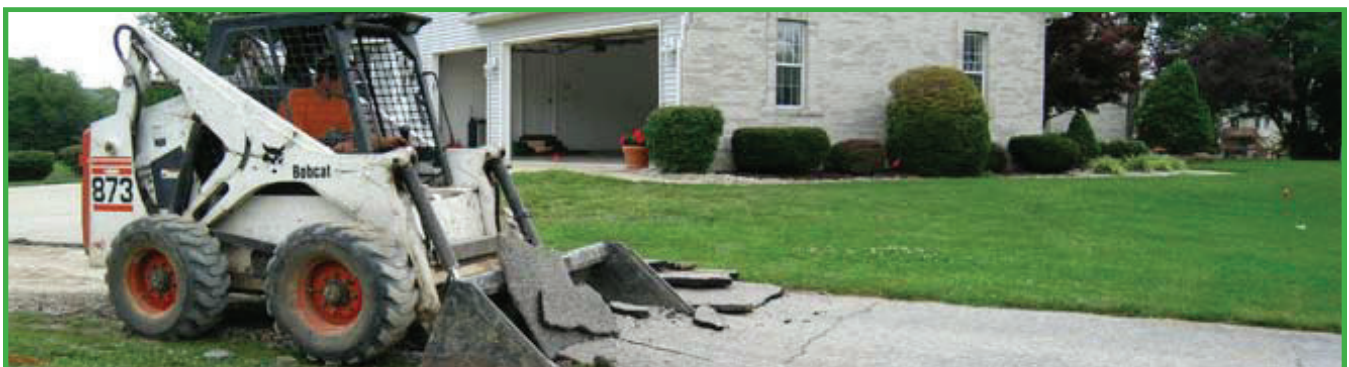
Usando un excavador para remover pavimento